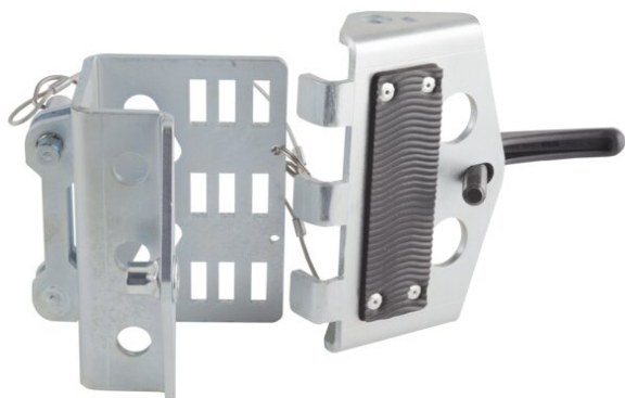
Montaż UTB na nodze statywu