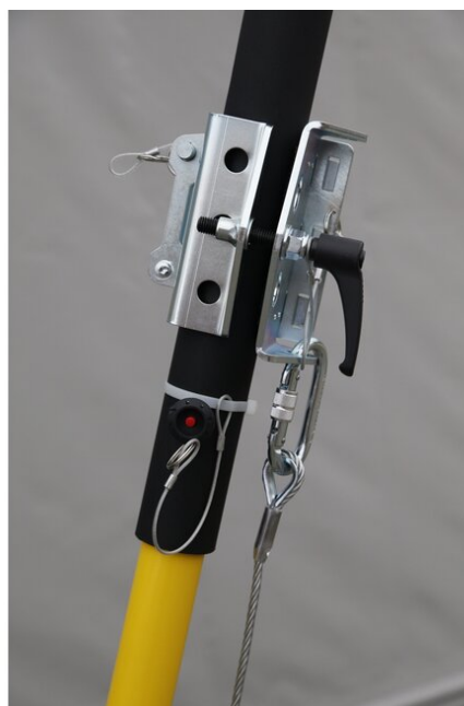
Montaż wyciągarki RUP506 do uchwytu UTB