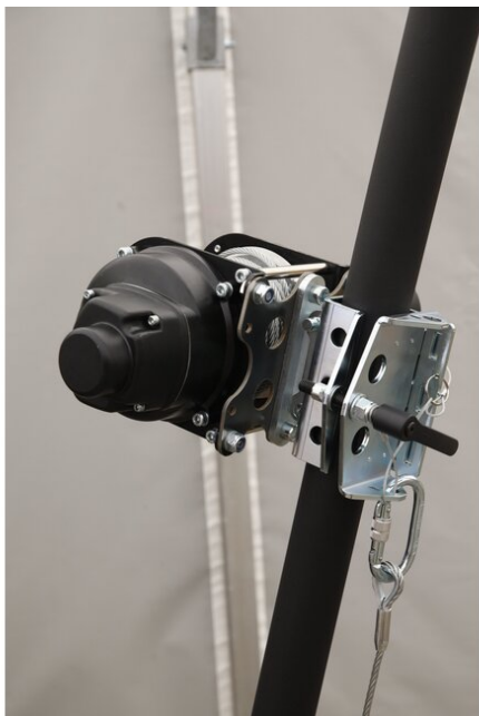
Wyciągarka RUP504 zainstalowana na nodze statywu TM15